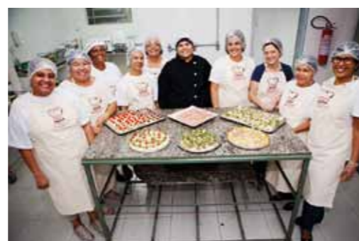
De flesta eleverna kommer från Complejo el Alemão, ett samlingsnamn på 13 favelor (slumområden). Så här långt har cirka 6 000 personer, främst kvinnor i åldrarna 16-30 år utbildats.