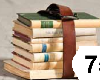
Det stora utbildningspaketet