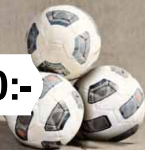
Fotboll för flickor, Moçambique