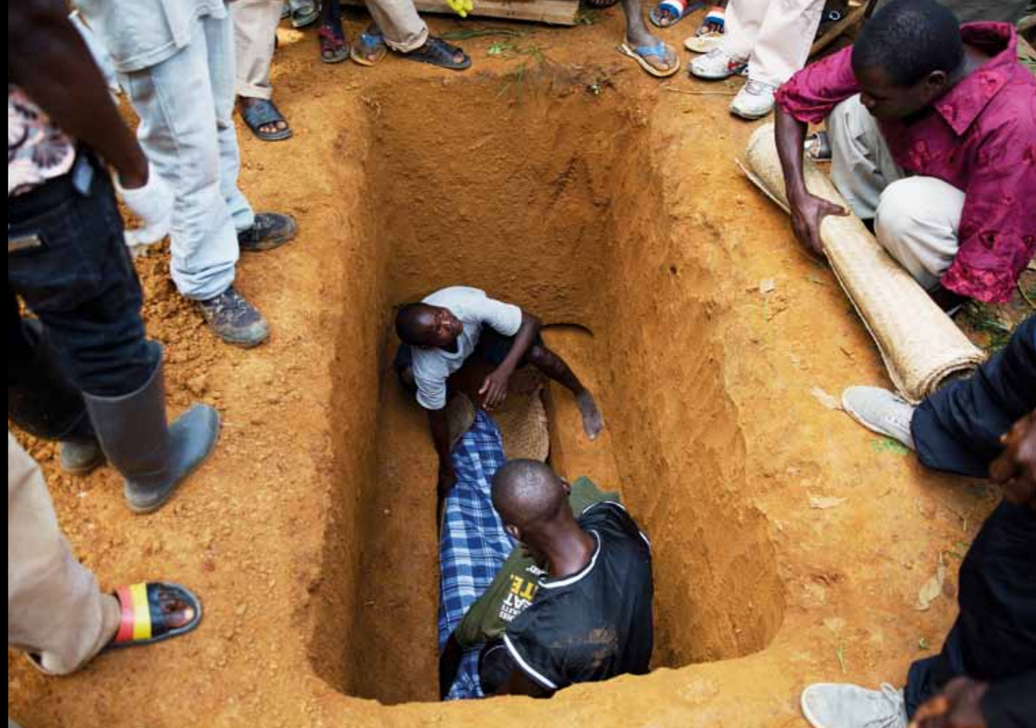
Kyrkogården i Foya är inte känd för sin skönhet utan för att den rymmer världens mest smittosamma lik.

Efter 5-6 dagar kan det tillkomma diarré, kräkningar, bröstsmärtor, röda ögon, sår i huden och utslag. I snitt infaller döden 8 dagar efter de första symtomen, orsakad av organsvikt, uttorkning eller medicinsk chock.