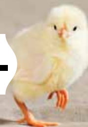
Kycklingpaket, Burkina Faso